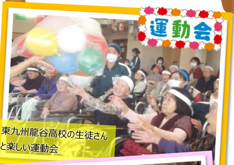
東九州龍谷高校の生徒さんと楽しい運動会