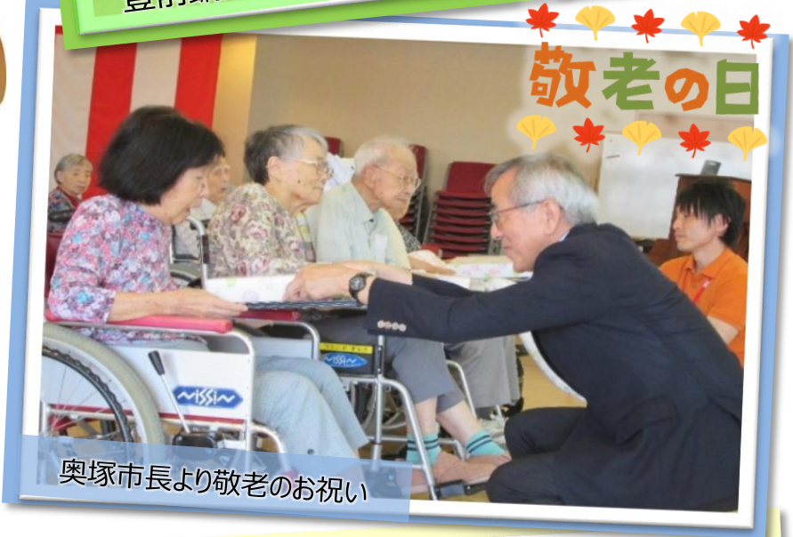
奥塚市長より敬老のお祝い