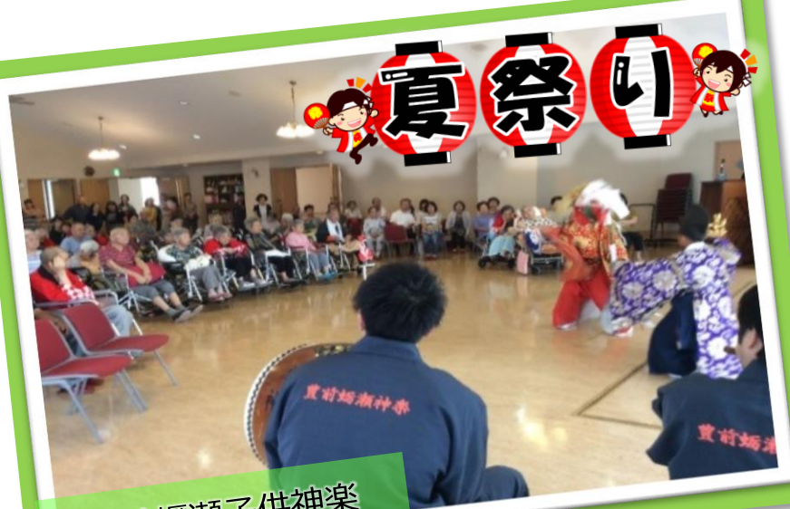
豊前蠣瀬子供神楽