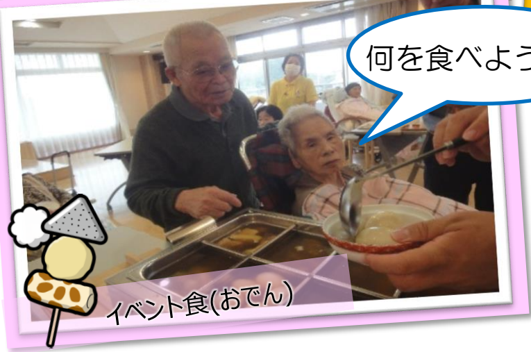
イベント食(おでん)